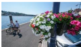
Blomster i lygtepæle og en flydende bro: Byggearbejde på turistprojekt færdigt