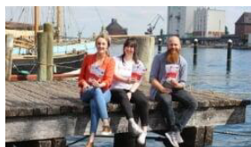
Bloddonorjagt begynder i Flensborg