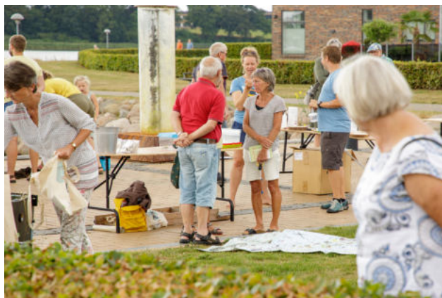
Eventet „En grøn dag, hvor blomster bygger broer“ lokkede flere hundrede besøgende til biodiversitetshaven i Gråsten.

Der var desuden guidede ture i Nordborg, Sønderborg og