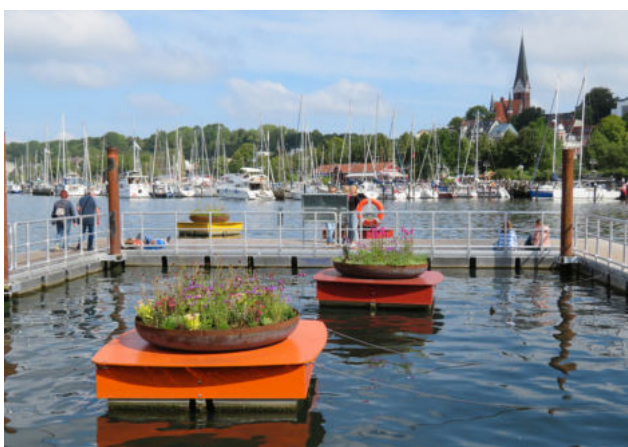
Haveanlægget „Flydende haver“ ved Flensborgs havnespids.

At kunne opleve fjorden, bogstaveligt talt, det var baggrunden og idéen for et broanlæg, der skulle rage ud fra bredden og ud i fjorden. Resultatet blev en U-formet ‚flydedok‘ ved havnespidsen, omgivet af ti blomsterøer på flydende pontoner, der bogstaveligt talt danner en flydende have.