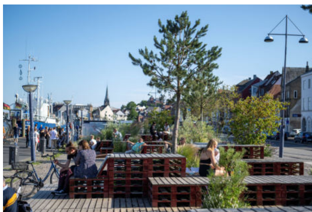
Amfiteateret ved Flensborgs museumshavn.

Flensborg Havn er et attraktivt og populært sted at slentre og hænge ud. På den østlige side findes der restauranter samt caféer og andre, som også tilbyder udendørs servering. Der er en legeplads og steder at hygge sig.