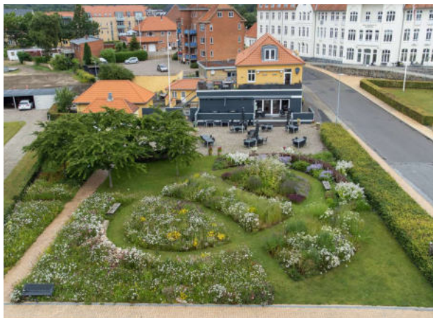
Biodiversitetshaven i Gråsten fra toppen.

I Gråsten skulle haveudstillingskonceptet bruges som inspiration og grundlag for en ny fortolkning, hvor naturen samt emneområder som maritim kultur og havekultur skulle inddrages i en aktiv turismeudvikling og fokusere på bæredygtighedstemaet.