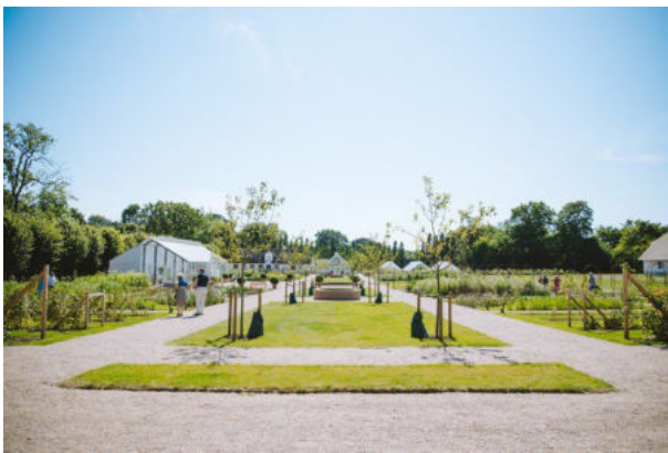
Den Kongelige Køkkenhave i Gråsten.