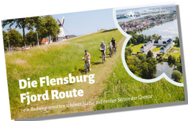
Cykelbogen kan fås som trykt udgave i fire sprog hos turistorganisationerne.

I samarbejde med turistforeningen Tourismus Agentur Flensburger Förde (TAFF) blev der som led i projektet udar-