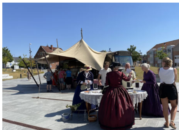
Historien om det Sønderjyske kaffebord blev fortalt med historiske kostymer og kage.

For at promovere den nye Tourguide blev der i samarbejde med projektpartneren Destination Sønderjylland (DSSJ), fonden Stiftung Schloss Glücksburg og Museum Sønderjylland afholdt tre familiearrangementer med fokus på „levende historie“. Fortællingerne fokuserede på grænsens historie – både i historisk forstand og i overført betydning. Til dette formål samarbejder turistbureauerne med et eventbureau fra Danmark, der har specialiseret sig i denne form for historiefortælling: Udbyderen „Eventør“ fra Sønderborg. I tæt samarbejde med turistorganisationerne TAFF og DSSJ samt værtsparterne Stiftung Schloss Glücksburg og Museum Sønderjylland blev der udviklet et kreativt koncept, en logistisk planlægning og den kunstneriske gennemførelse af arrangementerne.