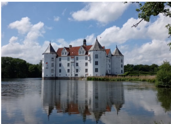
Vandslottet i Lyksborg.

Idéen var at skabe et produkt i form af et innovativt online-værktøj, som skulle indeholde en nytænkt service til både feriegæster og lokale i forbindelse med planlægning af udflugter og éndagsture med underholdningsværdi. Dermed får turismeaktører og kultur- og miljøinstitutioner i regionen en gratis platform, som rækker langt ud over projektets varighed, og hvor de kan markedsføre deres eksisterende tilbud samt udvikle nye produkter med udgangspunkt i værktøjets indhold. Nye målgrupper og medier skal tilgodeses, og regionen skal gøres synlig som en innovativ og nytænkende destination. Turportalen skal samtidig bidrage til Interreg-projektets overordnede mål om at fremme udviklingen af bæredygtig turisme med fokus på „aktiv ferie“.