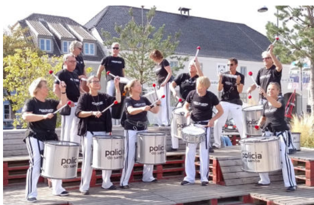
Sambagruppen Policia do Samba deltog i Havneparaden ved Flensburgs formidlingshaver.

I sommeren 2021 lagde „Amfiteateret“ lokation til Flensburg-festivalen „Kurzfilm Streifzug“. I efteråret 2022 sendte „Kultursejleren“ fra Kiel under overskriften „Poesie baut Brücken“ (Poesi bygger broer) tyske og danske digte til besøgende på Flensburg havn og ved formidlingshaverne. I begge tilfælde var der fokus på dansk-tysk kulturformidling.