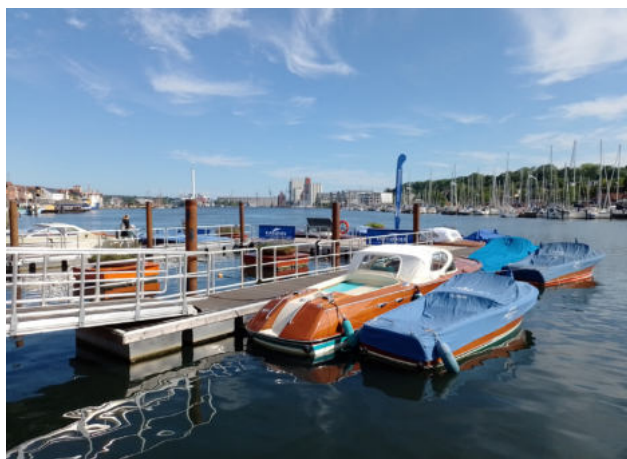
Bådsklubben Riva-Boats-Club Deutschland lagde til kaj ved Flensburgs Flydende Haver.

I foråret 2022 oprettede to unge biologer fra Flensburg og Kiel et bæredygtigt akvakulturanlæg for blåmuslinger og hjertemuslinger i de „Flydende Haver“: „Muslingehaven“. Den beriger fortællingen om de maritime formidlingshaver