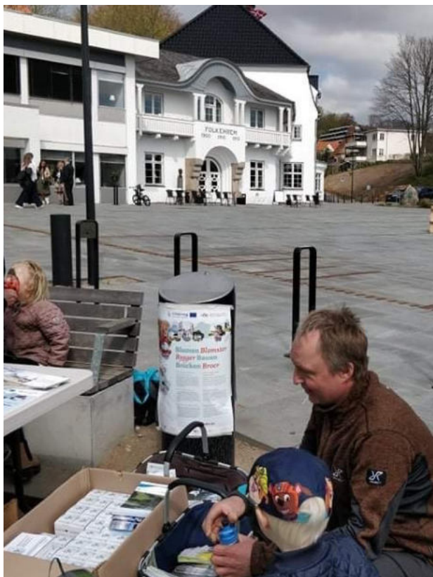
Arrangement ved Folkhjemmet i Aabenraa.

Formidlingstrappen stod færdig i foråret 2022 og blev officielt indviet i juni. Allerede i foråret blev der gennemført en række af arrangementer, med naturen og området ved formidlingstrappen som omdrejningspunkt. Arrangementerne blev gennemført i samarbejde med blandt andet lokalafdelingen i Danmarks Naturfredningsforening, Haveselskabet, Naturfamilier, Fuglelund Naturcenter og Aabenraa Bibliotek.