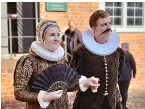
På Sønderborg slot og Lyksborg slot fulgte gæsterne på hertugernes fodspor.

tyske ferieregion og formidle den fælles historie gennem et alsidigt og interaktivt program for enhver alder på et historisk betydningsfuldt sted, nemlig Folkehjem i Aabenraa. Programmet var udviklet i samarbejde med Museum Sønderjylland og regionens mindretalsorganisationer.