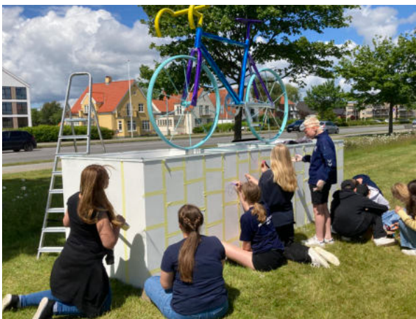
Danske og tyske kunstnere samarbejdede i kunstprojektet „Kunst i naturen“ med elever fra skolerne fra det danske og tyske mindretal.